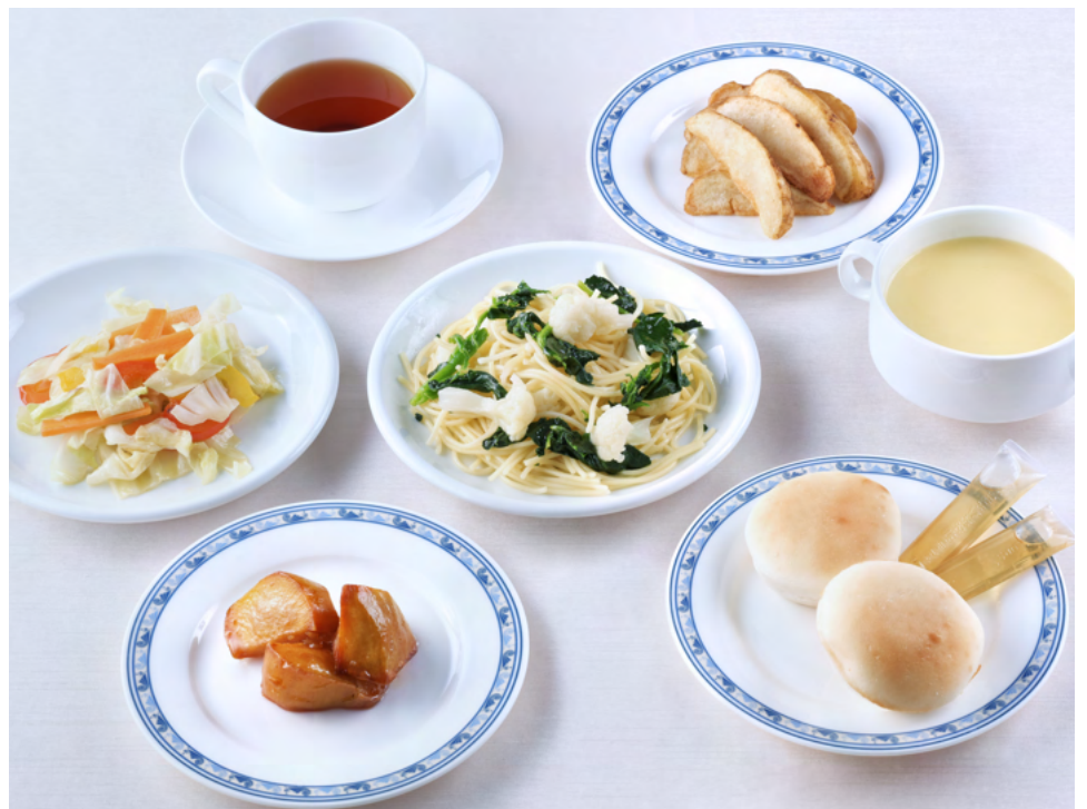
写真は1泊目メニュー