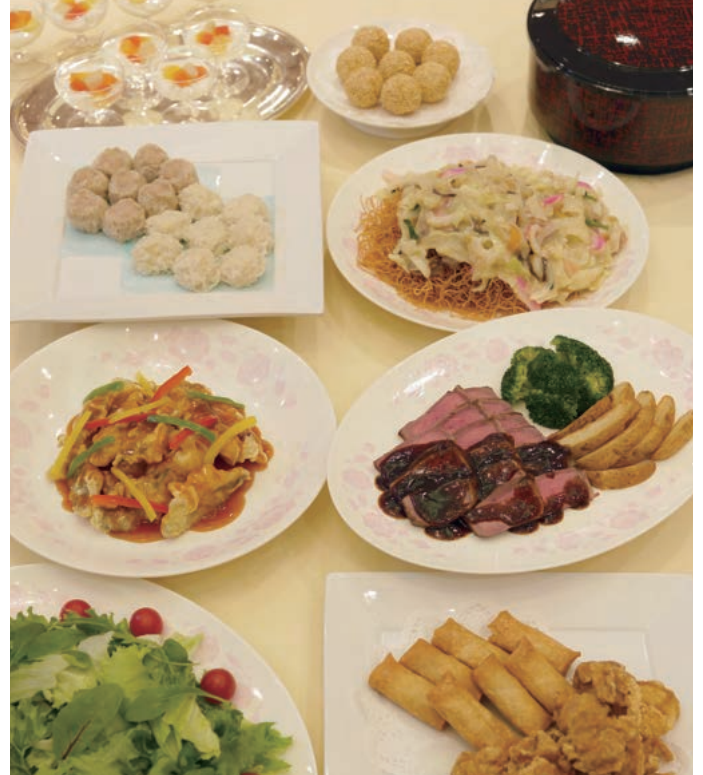
写真は高等学校メニュー