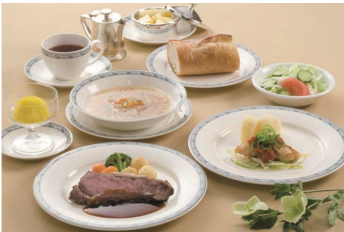
写真は高等学校メニュー