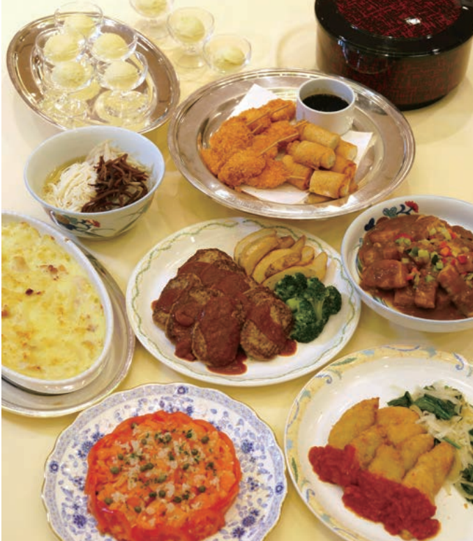
写真は高等学校メニュー