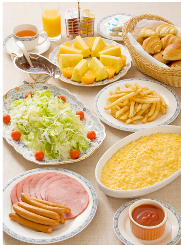
写真は1泊目メニュー