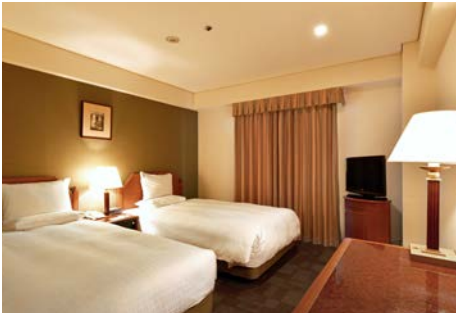
客室 (20 m 2 )