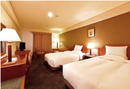
客室 (27 m 2 )