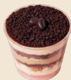
長崎焙煎珈琲のティラミス Tiramisu with Nagasaki Roasted Coffee