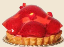
いちごのレアチーズタルト Strawberry Rare Cheesecake Tart