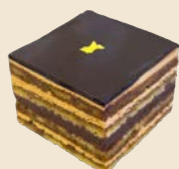
オペラ Classic Opera Cake