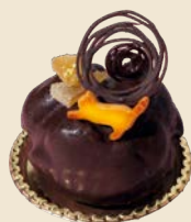
ザボン漬け入りボッシュボーレン Boschbolle with Candied Zabon