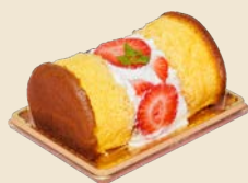
パン・デ・ロー ショートケーキ Pão de Ló Shortcake