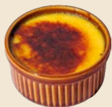
長崎みかんのクレームブリュレ Crème Brûlée with Nagasaki Mandarin oranges