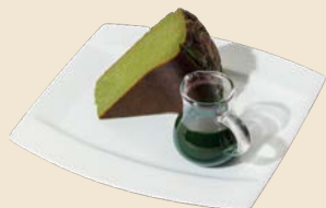
そのぎ抹茶のバスクケーキ Basque Cheesecake with Sonogi Matcha