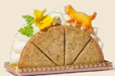
長崎レモンと和紅茶のクッキーサンド Nagasaki Lemon and Japanese Black Tea Cookie Sandwich